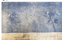
Elisabetta Diamanti, Pervinca ceruleo , 2020, ceramolle, acquaforte, puntasecca, 300 x 495 mm, 5/5