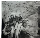
Elisabetta Diamanti, Piccoli girasoli , 2024, ceramolle, acquatinta, acquaforte, puntasecca, bulino, acido libero, 200 x 200 mm, edita dall'AAAC quale stampa n. 121 © Elisabetta Diamanti, foto AAAC