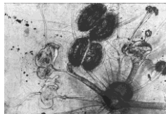
Elisabetta Diamanti, Stami II , 2011, maniera a lapis, acquaforte, acido libero, puntasecca, bulino, 355 x 500 mm, 2/5